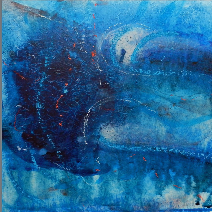
„Im Wasser“ #8, 2012, Mischtechnik auf Papier auf Holz, 50x50 cm