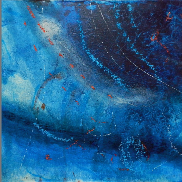
„Im Wasser“ #7, 2012, Mischtechnik auf Papier auf Holz, 50x50 cm