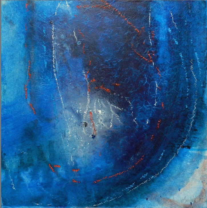
„Im Wasser“ #6, 2012, Mischtechnik auf Papier auf Holz, 50x50 cm