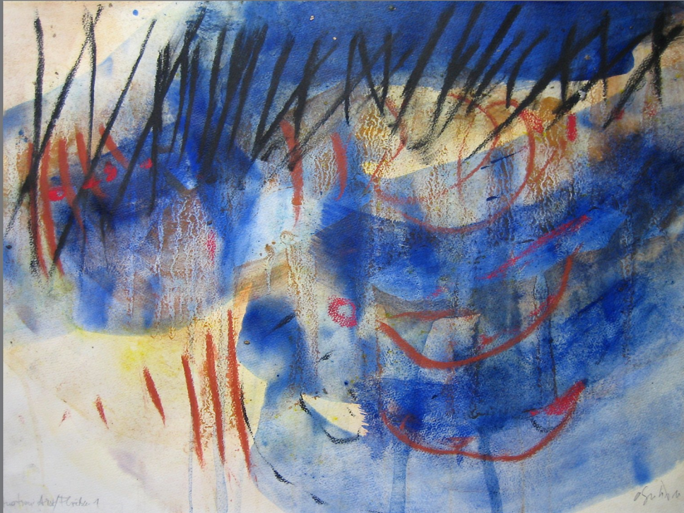
„Situation:Aist/Fließen #1, 2012, Mischtechnik auf Papier, 50x70 cm