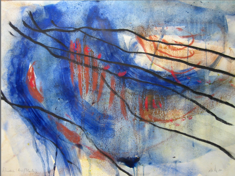
„Situation:Aist/Fließen #3, 2012, Mischtechnik auf Papier, 50x70 cm