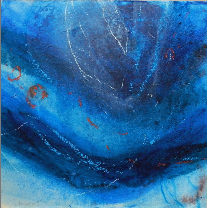
„Im Wasser“ #5 2012, Mischtechnik auf Papier auf Holz, 50x50 cm