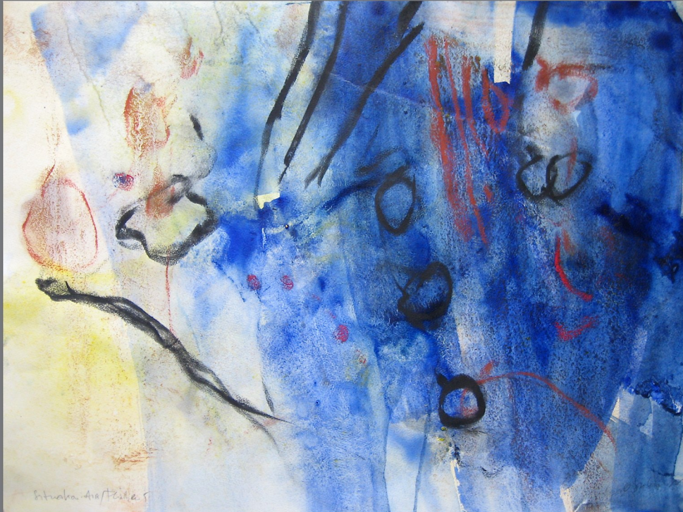
„Situation:Aist/Fließen #5, 2012, Mischtechnik auf Papier, 50x70 cm