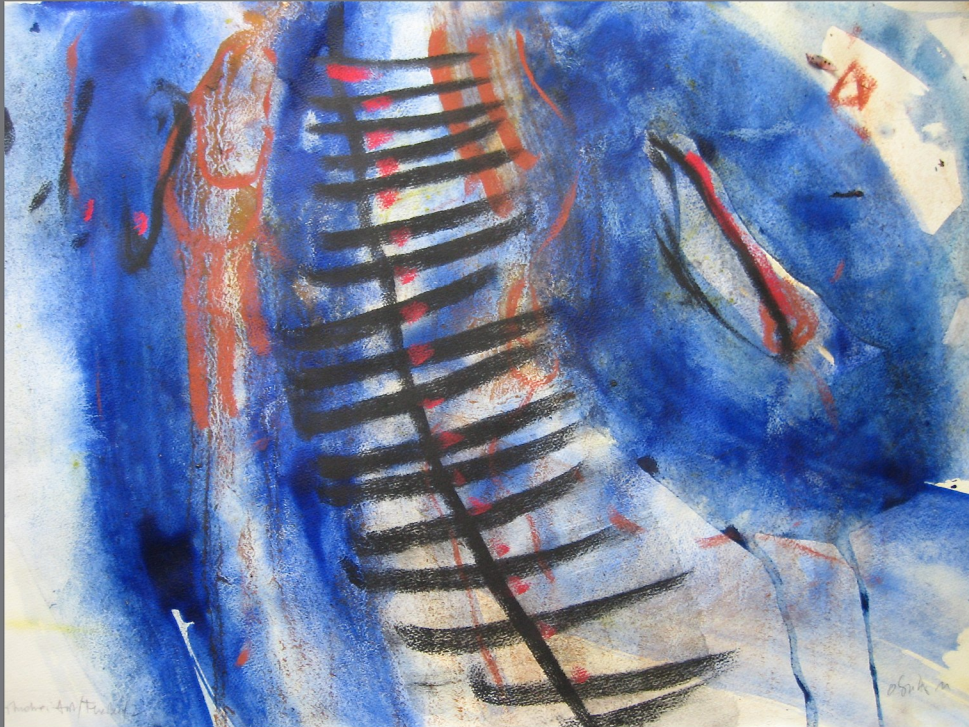
„Situation:Aist/Fließen # 2, 2012, Mischtechnik auf Papier, 50x70 cm