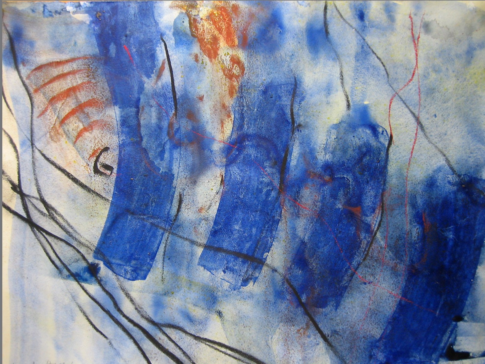
„Situation:Aist/Fließen #4, 2012, Mischtechnik auf Papier, 50x70 cm