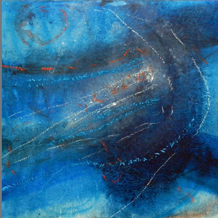
„Im Wasser“ #4, 2012, Mischtechnik auf Papier auf Holz, 50x50 cm