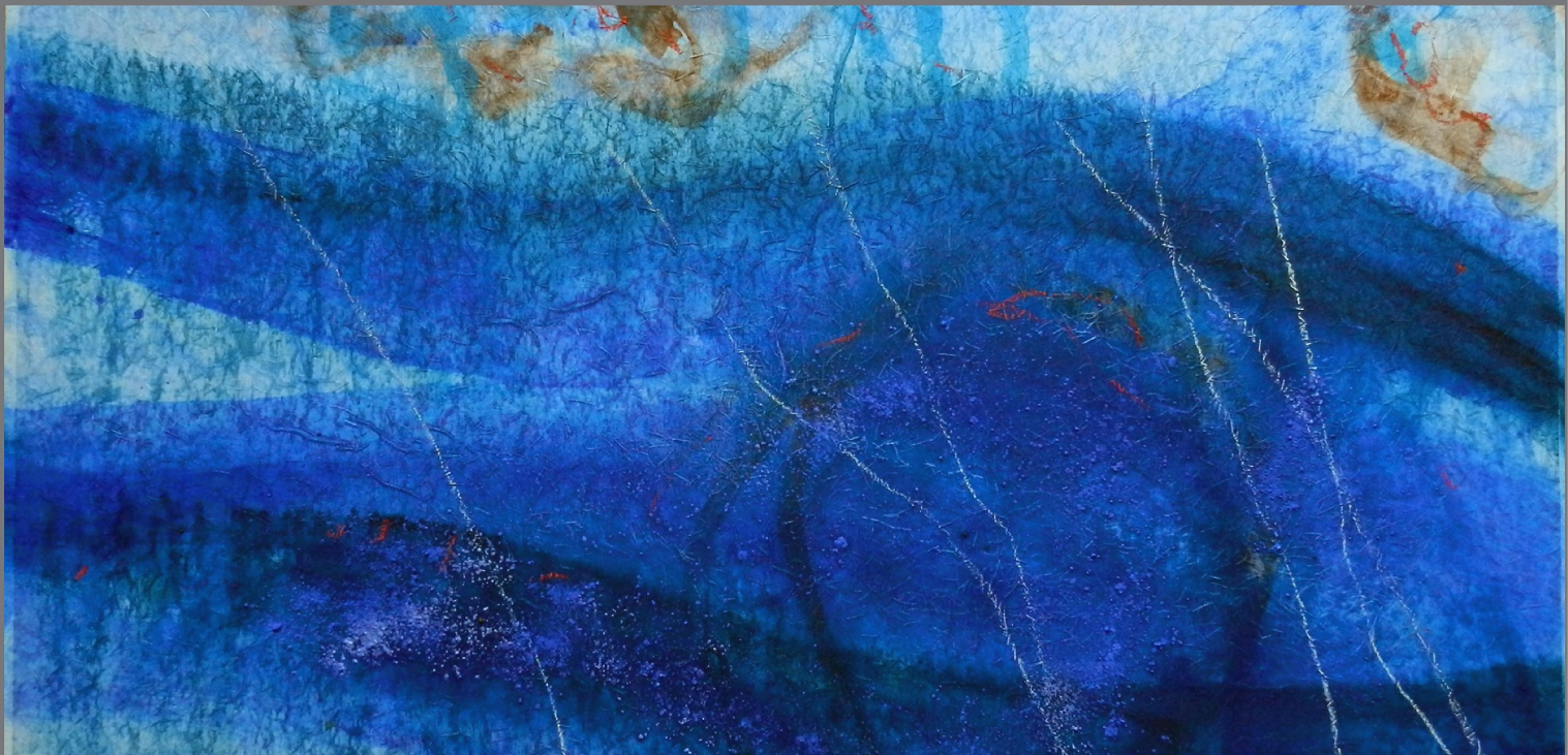
„Im Wasser“ #2, 2012, Mischtechnik auf Papier auf Leinwand, 60x90 cm