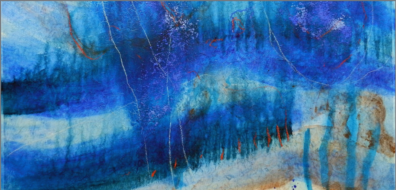
„Im Wasser“ #1, 2012, Mischtechnik auf Papier auf Leinwand, 60x90 cm